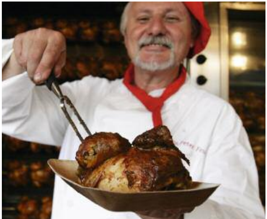
Le meilleur poulet rôti suisse rend et est toujours un délice.